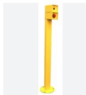
Fig.02 – Pedestal de Acionamento